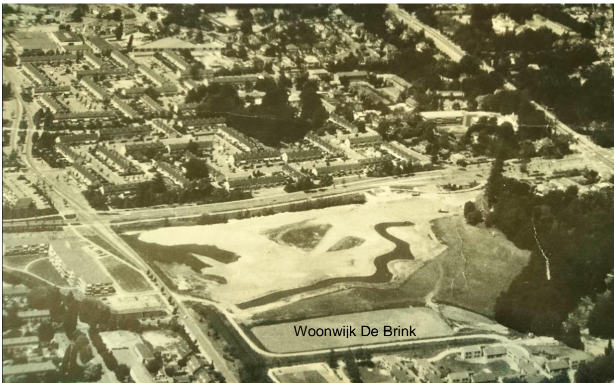
Detail luchtfoto 1978 ter gelegenheid van de opening van 't Holle Bloc' Zeist-West door het Utrechts Nieuwsblad.

Zeist-West kreeg zijn park, een uniek park waar Natuur, Landschap en Cultuurhistorie samengaan. Begin 2000 nam de Projectgroep De Brink, bestaande uit bewoners, natuur- en milieuorganisaties en het NMC Zeist het initiatief om hier met steun van de gemeente een natuurroute (inclusief informatieborden en natuurpadboekje) uit te zetten. Ook is indertijd een Natuurvisie voor het gehele landgoed opgesteld en ook uitgegeven. De Werkgroep Natuurlijk Zeist-West heeft in het kader van haar jubileum op zich genomen om in 2019 de informatie over het park en de natuurroute te vernieuwen.