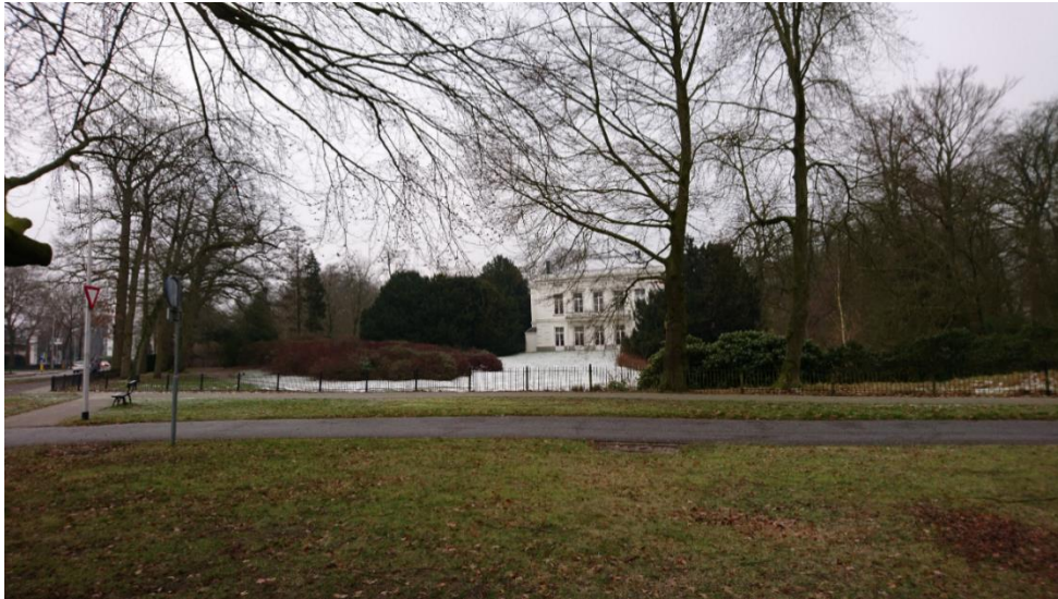
Zicht op het huis en voorzijde van het lustwarandepark De Brink (1856)

foto: februari 2019 genomen vanaf de middeleeuwse Brink