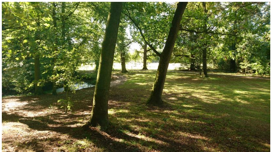
Foto: 7 oktober 2018 doorkijkje naar het open weidegebied.

Wat betreft het beheerplan en het bomenbeheer is het nodig om ook rekening te houden met de specifieke natuurwaarden die zich in de loop van 160 jaar ontwikkeld hebben.