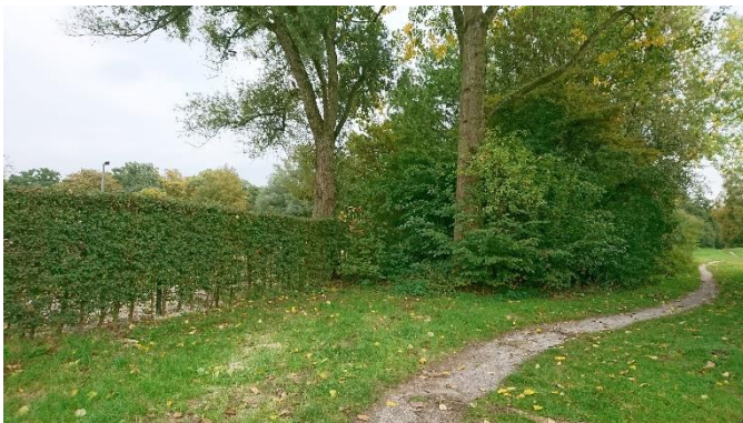
Meidoornhagen werden gebruikt als veekering, hier langs de kinderboerderij.