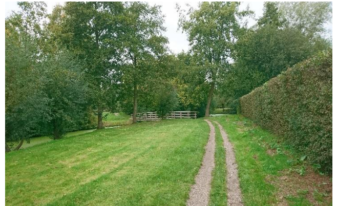
Verrassend open zicht op rivierenlandschap als je van hoger gelegen deel komt. Met karakteristieke meidoornhagen en knotwilgen