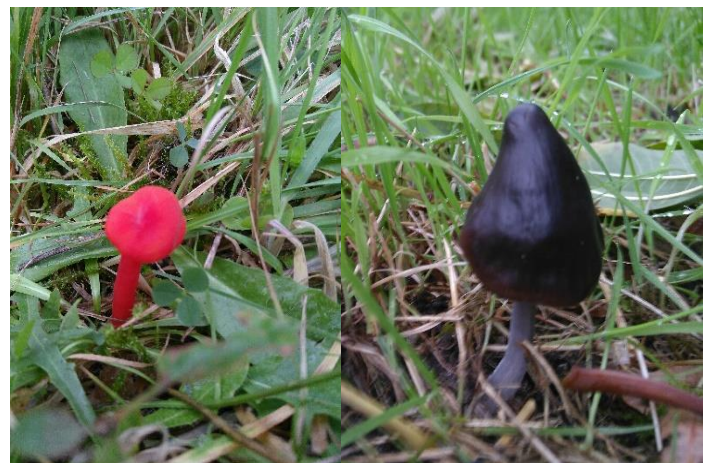
Zeldzame paddenstoelen.