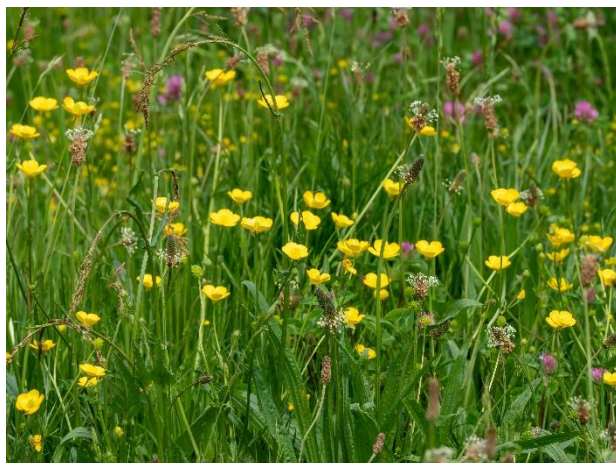
Bloemrijk grasland.