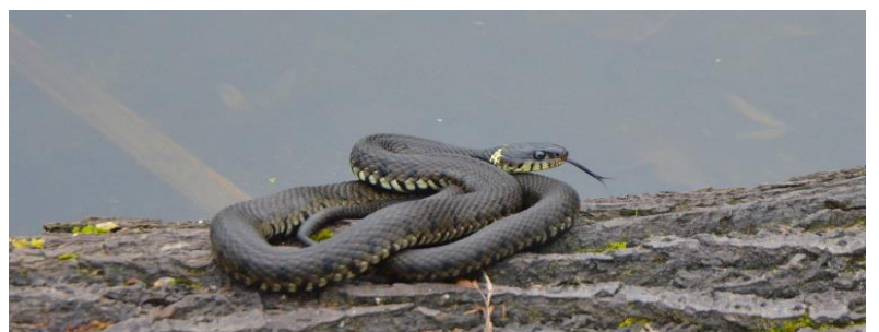
Zonnende ringslang bij poel.