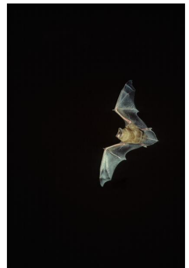
Rosse Vleermuis.