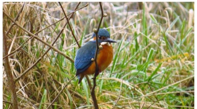
Ijsvogel langs de oever.