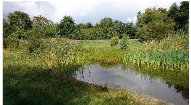
Poel meander, leefgebied voor o.a kikkers, ringslang, padden en libellen.