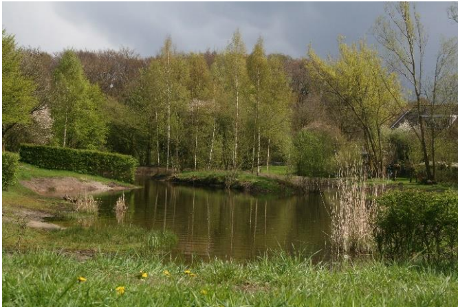
Poel meander met bloemenweide en meidoornhagen.