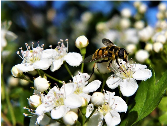
Wilde bij op meidoorn.