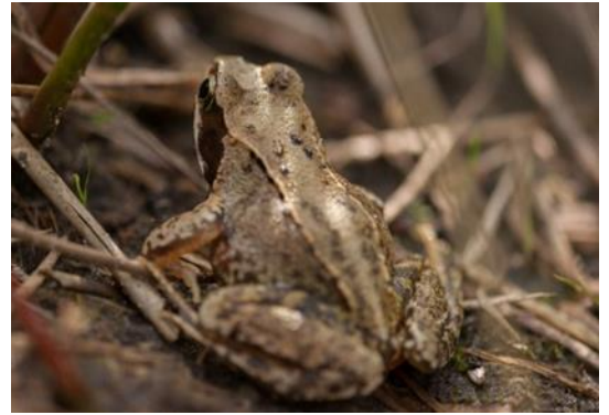
Bruine kikker.